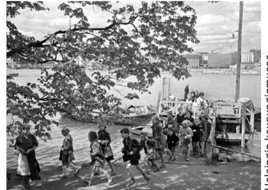
Helsingin kaupungin museo

Lukijakilpailun on laatinut toimittaja Aki Laurokari.