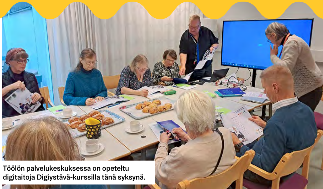
Töölön palvelukeskuksessa on opeteltu digitaitoja Digiyöstävä-kurssilla tänä syksynä.