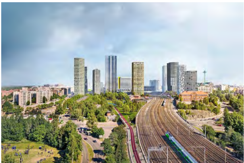
Arkkitehtitoimisto ALA Oy

Itä-Pasilaan tehtiin leikkipihoja uusien leikkipaikkoja koskevien mitoitus- ja suunnitteluohjeiden mukaisesti. Oli uutta antaa lasten leikeille tällaiset suunnitellut puitteet kortteleiden pihuille.