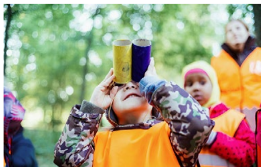
Three lower secondary schools in Helsinki started bilingual fi-en education programmes this autumn.

This year Helsinki launched continuous admissions to ease new arrivals’ transition into school, alongside preparatory education. To