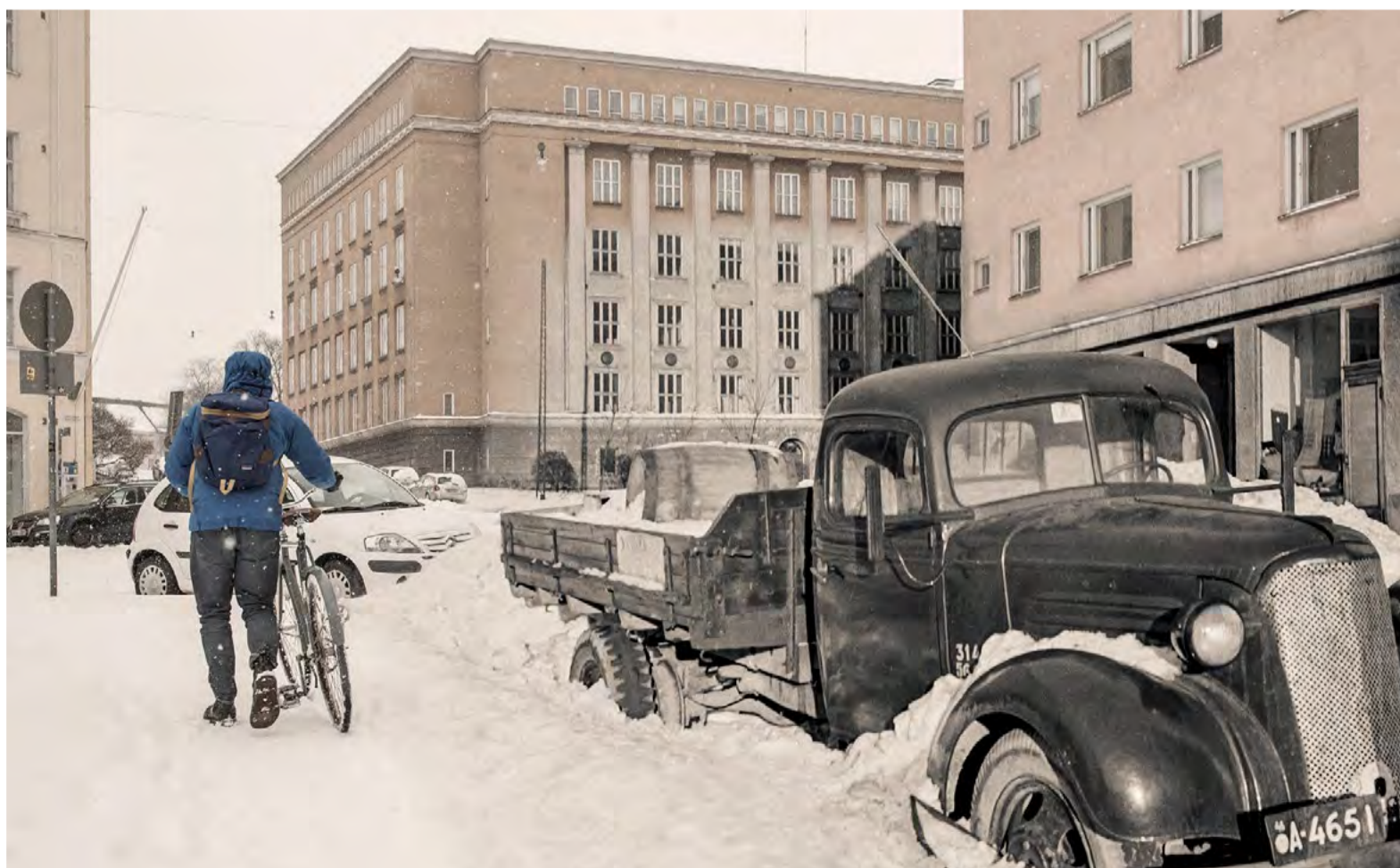
Kuvat: Mojo Erämetsä ja Väinö Kannisto/Helsingin kaupunginmuseo

Mojo Erämetsän aikamatkakuvissa yhdistyvät historiallinen ja nykypäivän Helsinki. Teoksen ”Lunta tulvillaan” pohjana on Väinö Kanniston kuva Kalliosta 1940-luvulta.