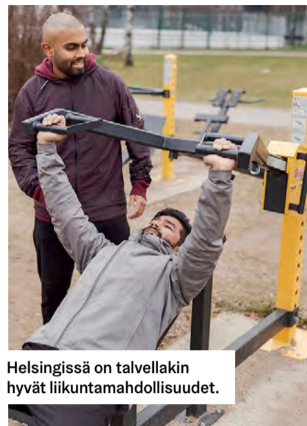
Helsingissä on talvellakin hyvät liikuntamahdollisuudet.