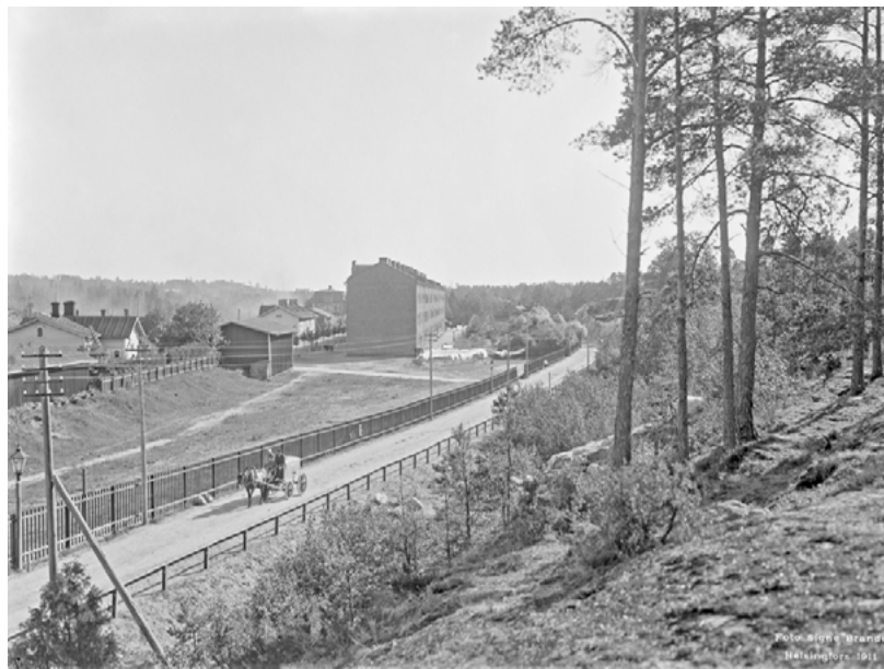
Signe Brander/Helsingin kaupunginmuseo

Länsi-Pasila kasvoi nopeasti 1800-luvun lopussa. Asemakaavaa ja rakennusmääräyksiä ei ollut, joten alueelle rakennettiin hyvin vapaasti. Keskellä on Pasilan kirkko. Alue purettiin 1970-luvulla.