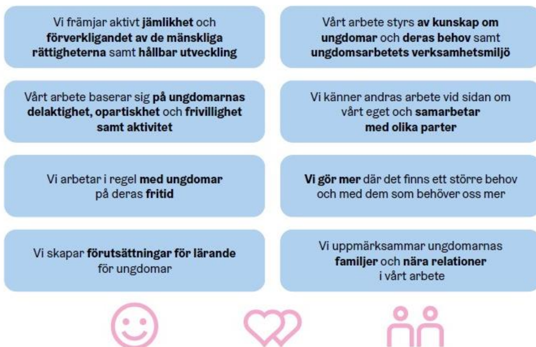
Bild 3. Principer som styr vårt arbete

Inom NUPS-processen definierades åtta principer, som styr allt vårt arbete.