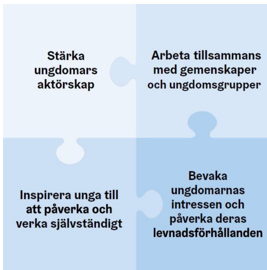
Bild 4. Ungdomstjänsternas fyra arbetsformer. De fyra pusselbitarna på bilden illustrerar hur ungdomstjänsternas arbetsformer överlappar och kompletterar varandra. Dessa fyra arbetsformer är: Stärka ungdomars aktörskap. Arbeta tillsammans med gemenskaper och ungdomsgrupper. Inspirera unga till att påverka och verka självständigt. Bevaka ungdomarnas intressen och påverka deras levnadsförhållanden.